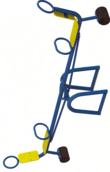
Рис.2 – Общий вид.

19.1 Зона безопасности игрового оборудования 5х3м.